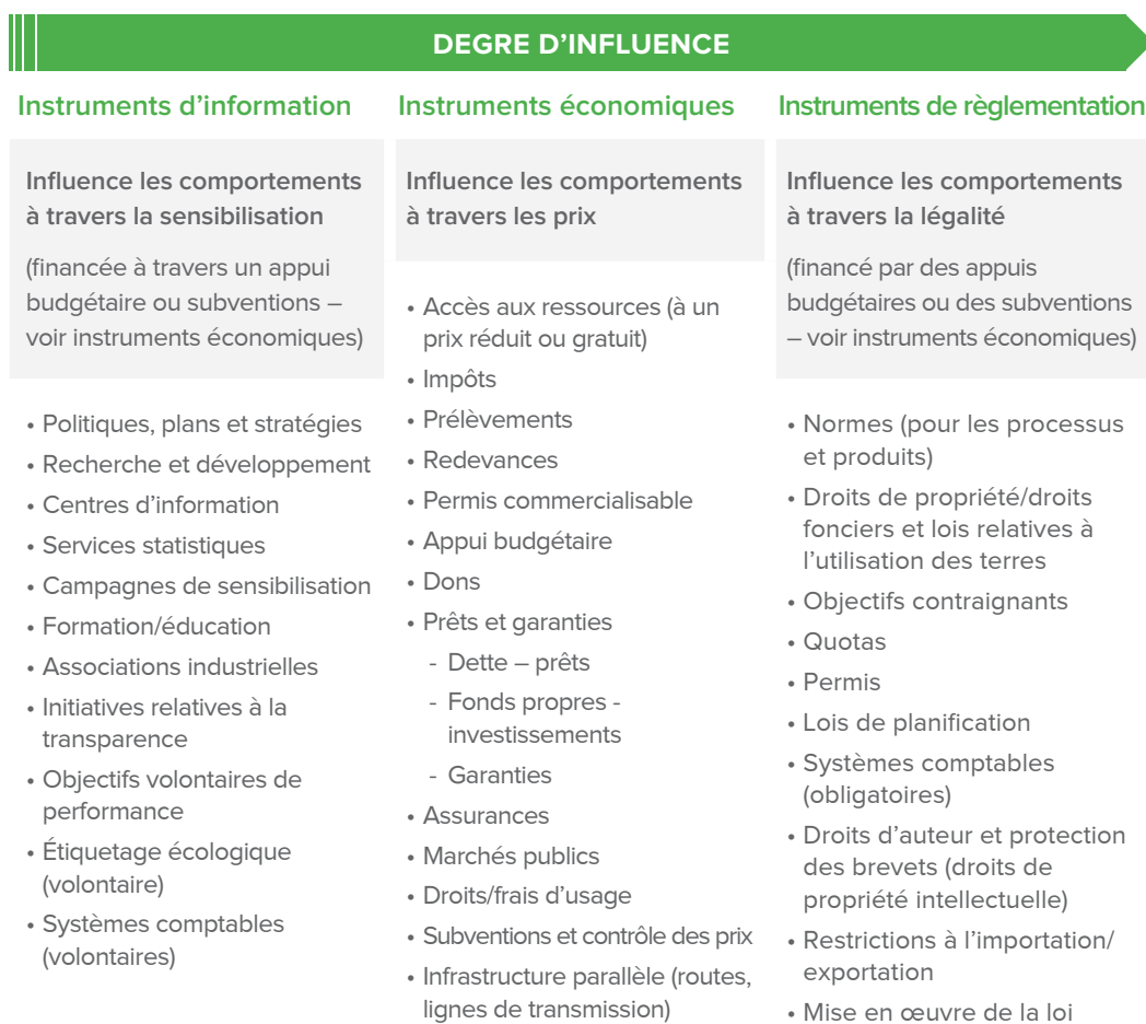
Schéma 4 : Instruments de soutien gouvernemental (ODI, 2015)

Les subventions peuvent être très variées et inclure : instruments de réglementation ; taxes et redevances pour les utilisateurs des terres et les acteurs des chaînes d'approvisionnement ; tarifs de rachat ; crédit agricole; assurance publique contre la perte de revenus dans le secteur agricole ou paiements carbone. Le Schéma 4 fournit une liste plus complète d'exemples de subventions.