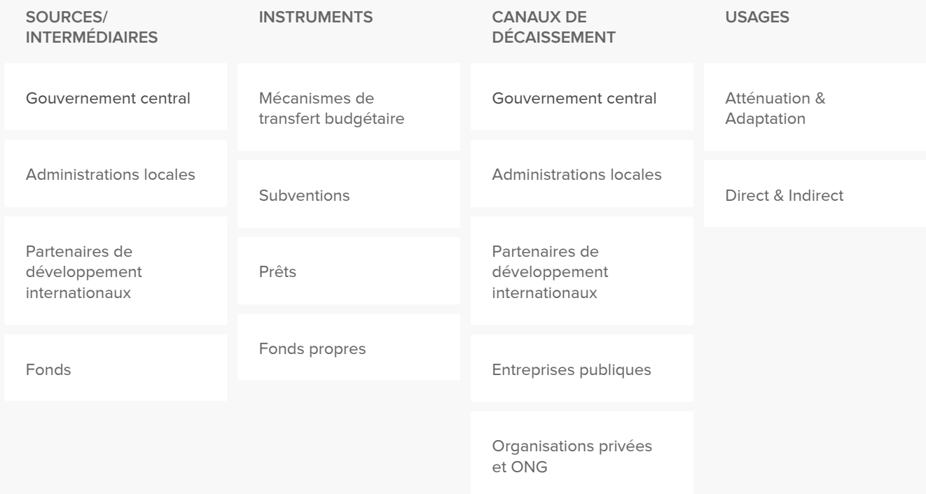
▲ Schéma 9 : Vue d'ensemble conceptuelle du cycle de vie des financements de l'action climatique.

Le Schéma 9 illustre le cycle de vie des financements généralement cartographiés dans les exercices de cartographie des financements climat. Il met en évidence les acteurs qui font transiter les financements, les instruments utilisés pour attribuer l'argent et les activités réalisées avec cet argent. L'équipe du projet doit convenir des rubriques horizontales à inclure et de l'ensemble des catégories verticales. Ces catégories vont ensuite être utilisées lors du traitement des données